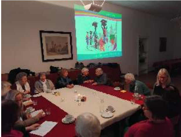
Vorstand und Gemeindeversammlung