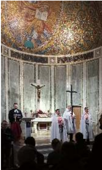
Kreuzweg mit den Kirchen des Viertels