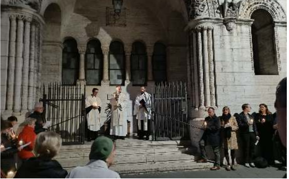
Ostergottesdienst mit Spatzenmesse (W. A. Mozart)