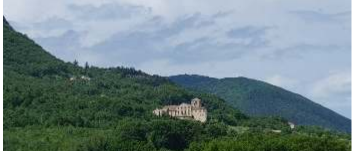
Gemeindeausflug - Mittagessen bei Rieti